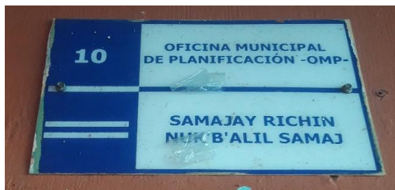
FOTOGRAFIA NO. 2