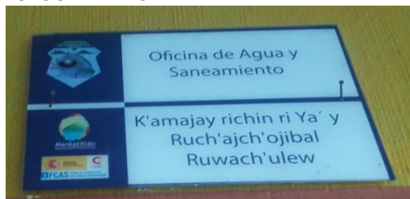
FOTOGRAFIA NO. 1