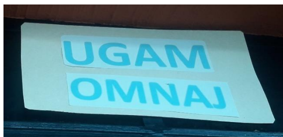
FOTOGRAFIA NO. 3