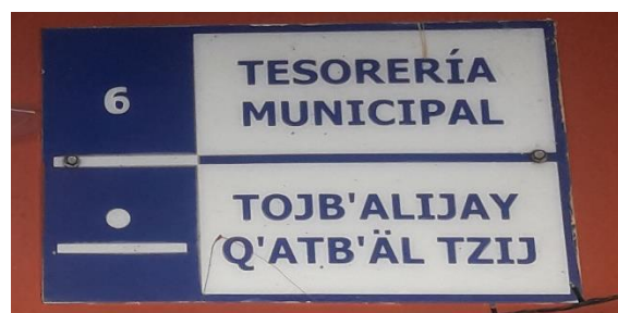
FOTOGRAFIA NO. 4