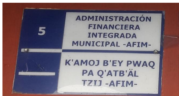
FOTOGRAFIA NO. 5