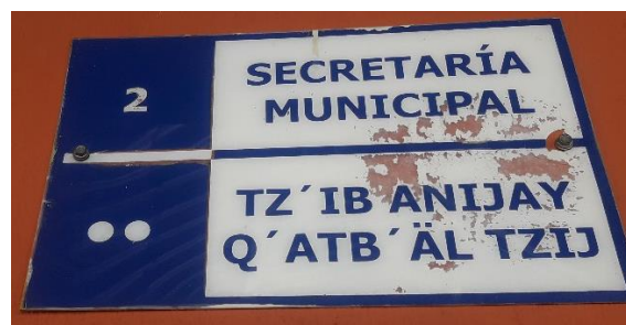
FOTOGRAFIA NO. 6