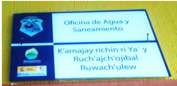
FOTOGRAFIA NO. 2