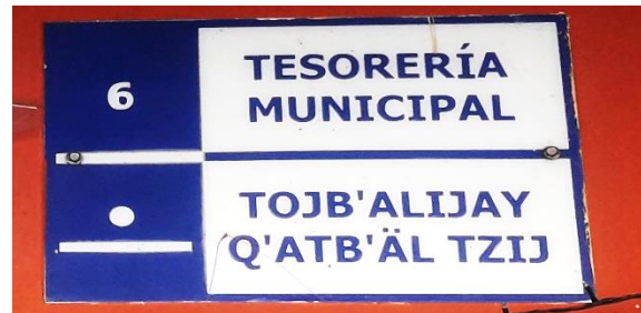
FOTOGRAFIA NO. 4