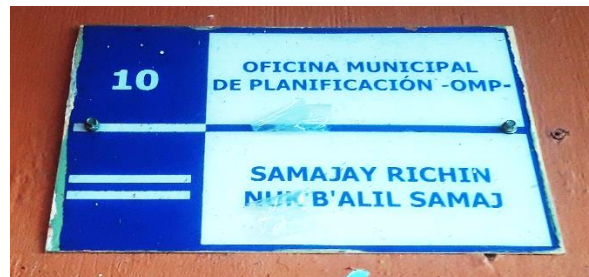
FOTOGRAFIA NO. 2