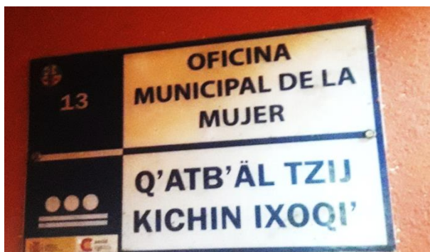
FOTOGRAFIA NO. 7