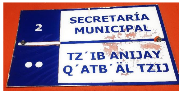
FOTOGRAFIA NO. 6