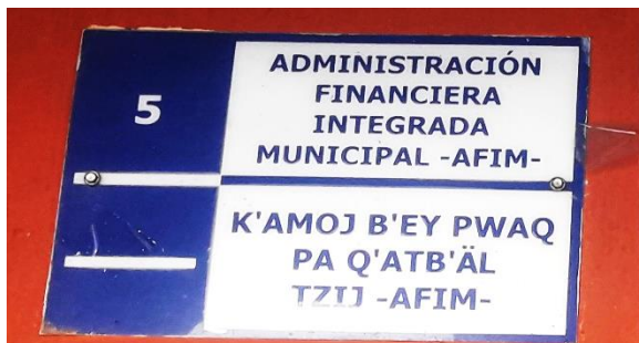
FOTOGRAFIA NO. 5