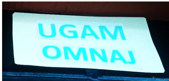
FOTOGRAFIA NO. 3