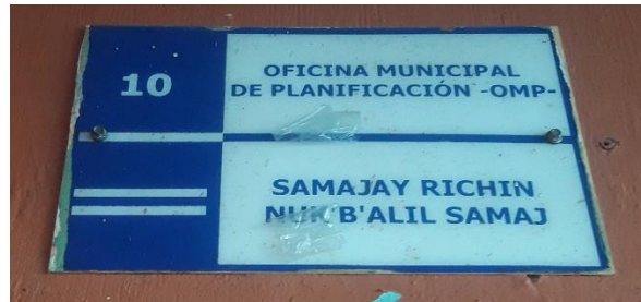
FOTOGRAFIA NO. 2