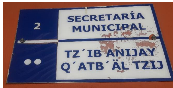
FOTOGRAFIA NO. 6