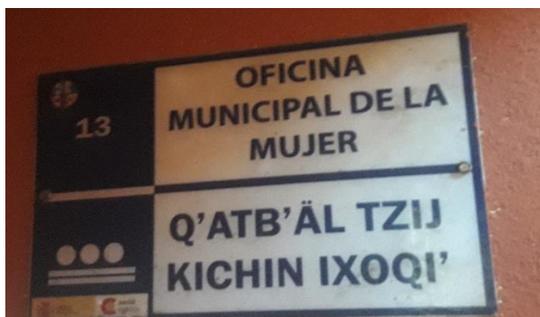
FOTOGRAFIA NO. 7