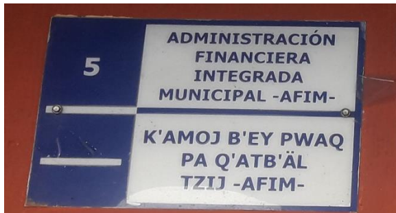
FOTOGRAFIA NO. 5