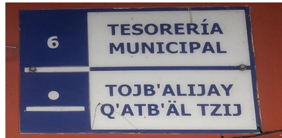
FOTOGRAFIA NO. 4