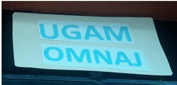
FOTOGRAFIA NO. 3