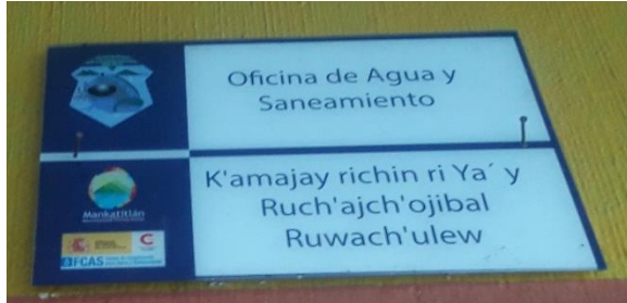
FOTOGRAFIA NO. 1