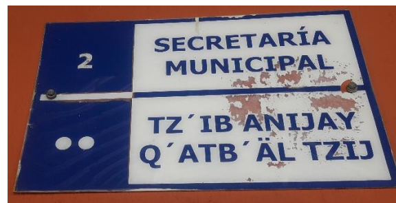
FOTOGRAFIA NO. 6